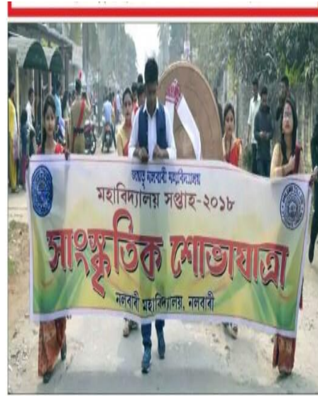
নলবারী মহাবিদ্যালয় সপ্তাহ উপলক্ষে উলিওরা বর্ণাশ্রম সংস্কৃতিক শোভাযাত্রা, গুৰুৱাৰে